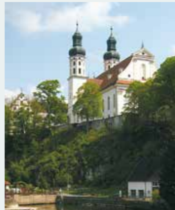
Münster Obermarchtal an der Donau