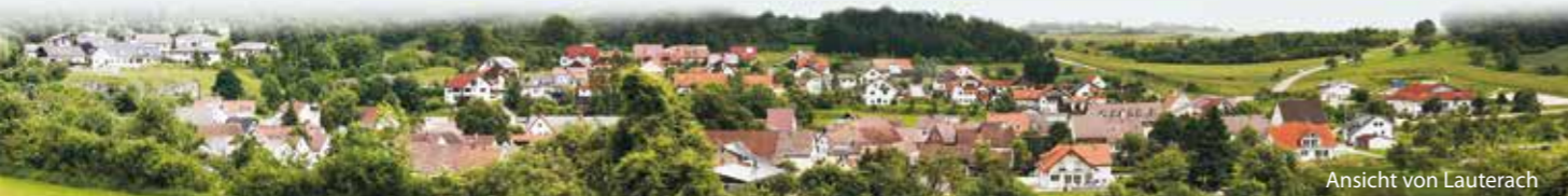
Ansicht von Lauterach