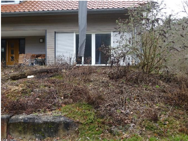
Bild 1 im Winter: viele abgestorbene Triebe müssen entfernt werden.

Einige Mitglieder der Biosphärengruppe Lauterach haben zum Frühlingsanfang das Staudenbeet beim Info-Zentrum aus dem Winterschlaf geholt und für den Austrieb im Frühjahr und Sommer vorbereitet. Dazu drei Bilder: