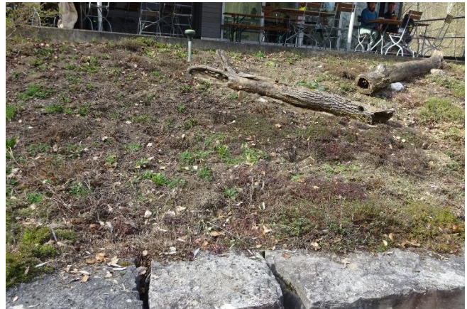
Bild 2 im März: Nach dem Arbeitseinsatz sieht man schon den Ansatz für viele neue Triebe