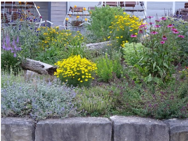
Bild 3: vom vergangenen Sommer; so üppig könnte es im Sommer wieder blühen.