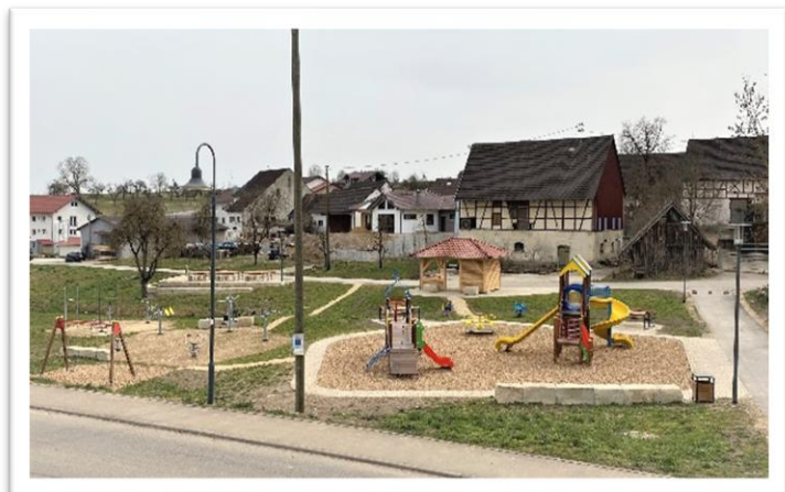
Gemeinde Emeringen, Alb-Donau-Kreis