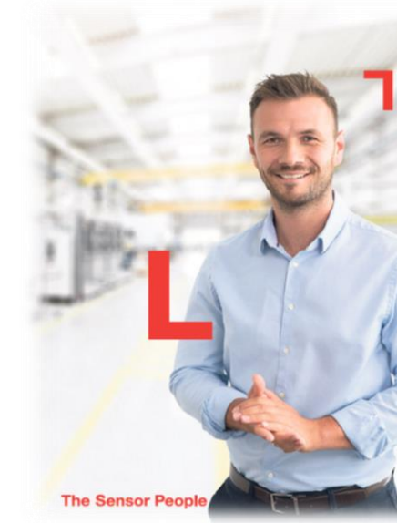
The Sensor People