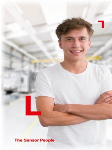
The Sensor People