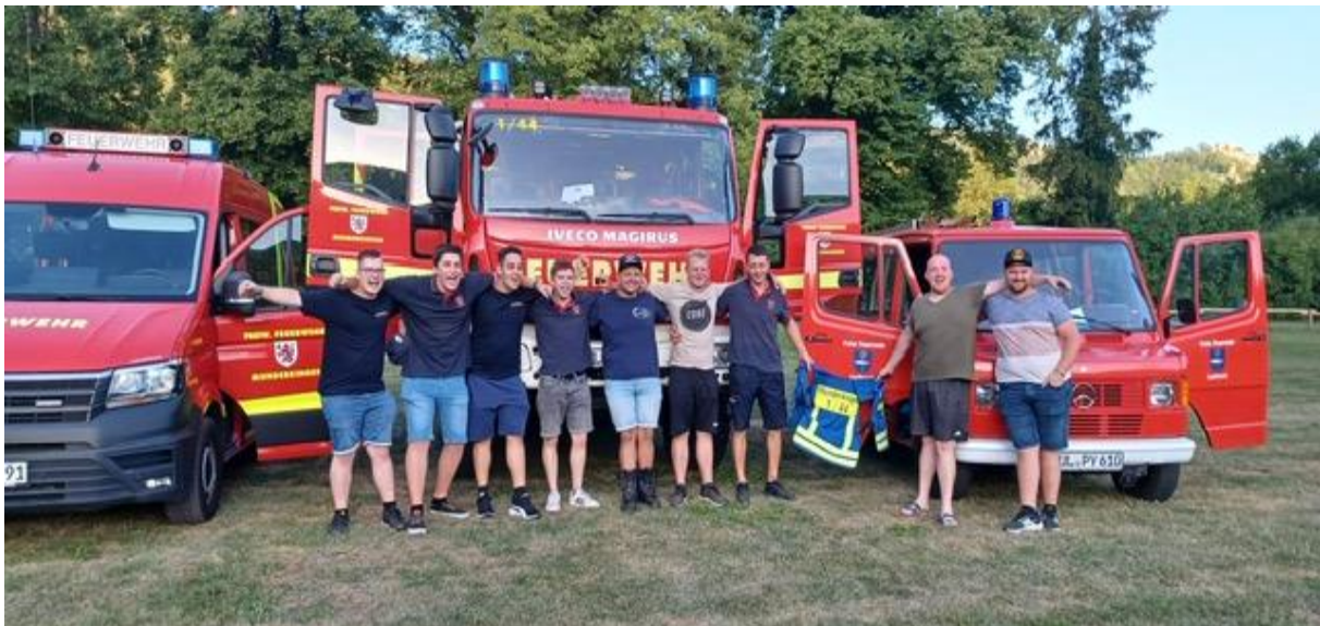
Bilder der Teilnehmer für das Leistungsabzeichen in Silber

Diesen erfreulichen Bericht hat uns die Feuerwehr übersandt. Wir gratulieren sehr herzlich und bedanken uns für den freiwilligen Einsatz zum Wohl unserer Gemeinde!