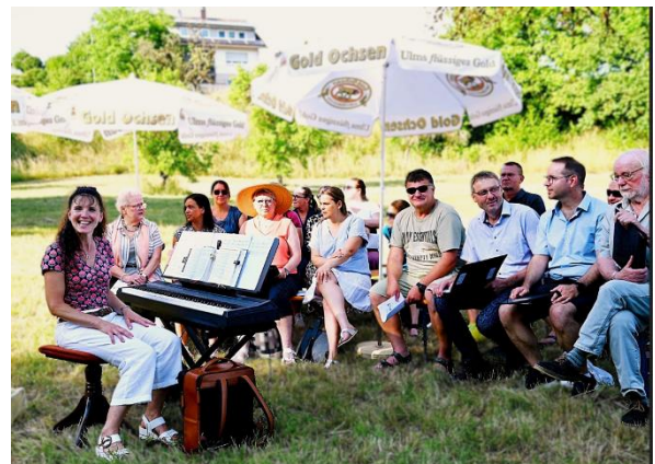
Bild: "Mitglieder vom Chor fEinklang beim „ökumenischen Gottesdienst im Grünen“ in Kirchen"